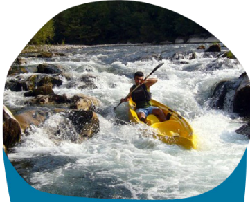
PARCOURS EN CANOË