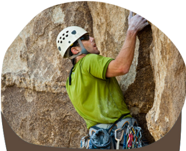
PARCOURS VERTICAL ET ESCALADE