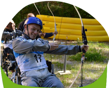
TIR À L'ARC ET SARBACANE