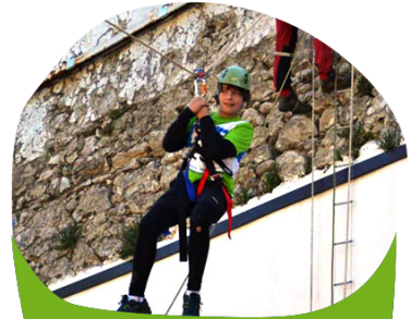
DESCENTE EN TYROLIENNE